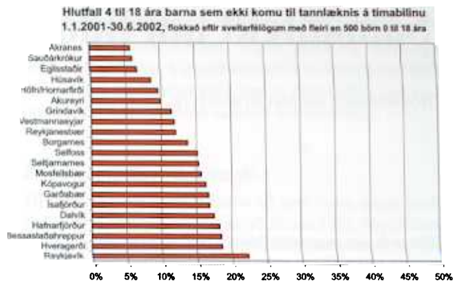
Mynd 3: Hlutfall 4 til 18 ára barna sem ekki komu til tannlækna á tímabilinu 1.1.2001 – 30.6.2002, flokkað eftir sveitarfélögum með fleiri en 500 börnum 0 til 18 ára

Ljóst er af þessari könnun að almennt er farið fullseint með íslensk börn í fyrstu heimsókn til tannlækna, en einungis um 18% tveggja ára barna og tæplega helmingur þriggja ára barna fór til tannlækna á umræddu tímabili. Athygli vekur að tannlækningaþjónusta virðist almennt betur sótt utan Reykjavíkur. Í ljósi þess að flestir tannlæknar eru starfandi á höfuðborgarsvæðinu en hins vegar er aðsókn barna til tannlækna hvað minnst á því svæði vakna spurningar um hvort ekki sé úrbóta þörf á þessu sviði.